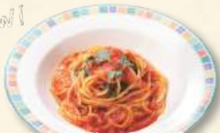
フレッシュトマトのパスタ