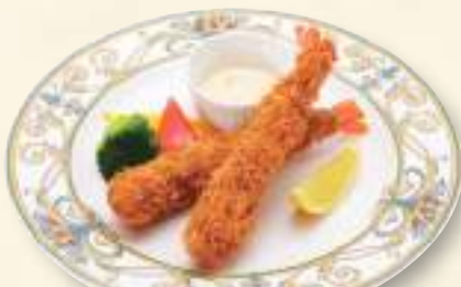
エビフライ 980円(税込1,058円)