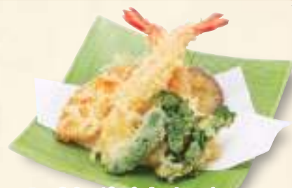
天ぷら盛り合わせ 980円(税込1,058円)