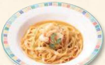
海老クリームパスタ