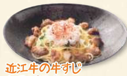
近江牛の牛すじ 和風パスタ