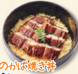
鰻のかば焼き丼 1,580円(税込1,706円)