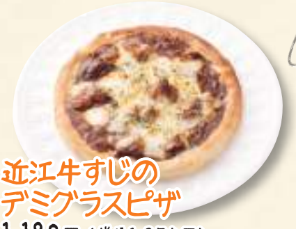
近江牛すじの デミグラスピザ