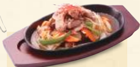
昔ながらのジンギスカン 1,080円(税込1,166円)