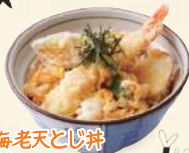
海老天とじ丼 690円(税込745円)