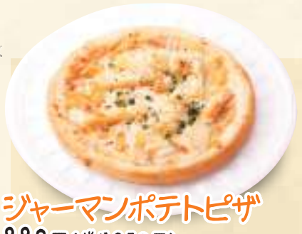
ジャーマンポテトピザ