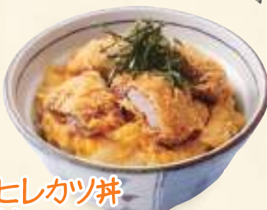
ヒレカツ丼 690円(税込745円)