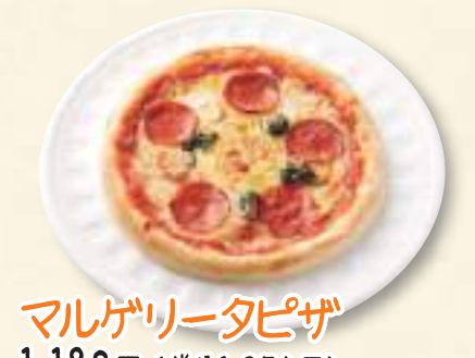
マルゲリータピザ