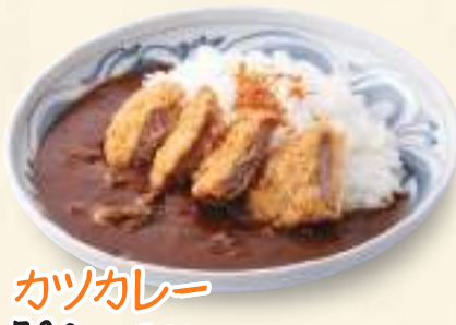
カツカレー 780円(税込842円)