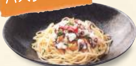
真タコのペペロンチーノ