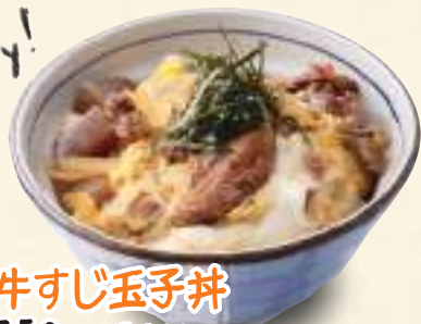
牛すじ玉子丼 750円(税込810円)