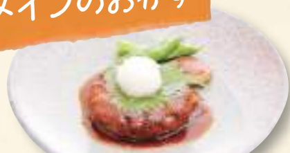
和風おろしハンバーグ 780円(税込842円)