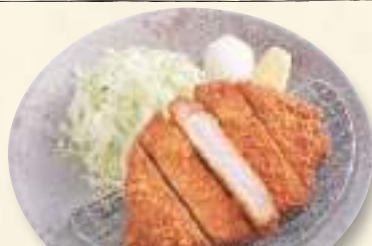
三元豚ロースのトンカツ 1,180円(税込1,274円)